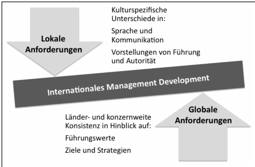
Abb. 2: Management Development im Spannungsfeld von lokalen und globalen Anforderungen

Unternehmen mit über 10.000 MitarbeiterInnen international: „Das Unternehmen hatte bis vor Kurzem kein gemeinsames MD-Programm. Seit einiger Zeit wird ein erstes gemeinsames und zentral gesteuertes Element (Management Evaluation and Succession Planning) für die gesamte Konzerngruppe eingesetzt. Im Übrigen sind die Kompetenzen in den Bereichen Personalentwicklung und Weiterbildung dezentral angesiedelt. Die einzelnen Business Units haben allerdings die Möglichkeit, Leistungen der zentralen Personalentwicklung anzufordern.“